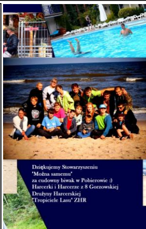
Dziękujemy Stowarzyszeniu „Można samemu” za sfinansowanie biwaku w Pobierowie 3 Harcerki i Harcerze z 8 Gorzowskiej Drużyny Harcerskiej „Tropiciele Lasu” ZHR